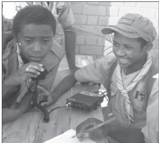
Des membres du Tily en activité de «Jamboree On The Air»