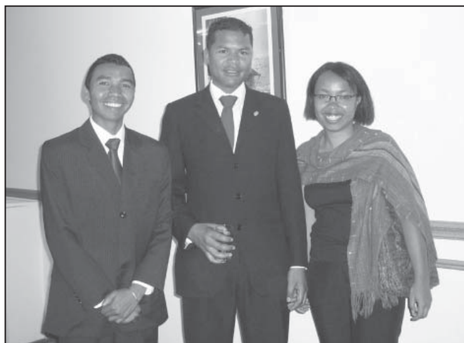
Tanora miatrika ny fanontoloana sy ny taonarivo fahatelo, «ho amin'ny demokrasia manara-penitra»

Ny fampiofanana ny mpikambana ato aminay dia anisan'ny laharam-pahameha satria miainga avy ato avokoa ny fanentanana sy ny fampahafantaranana tian-katao rehetra avy eo. Ny MFM moa dia anisan'ny manampy betsaka amin'io fanofanana io, na amin'ny fanomezana olona mpampiofana izany na amin'ny fiantohana ny fiofanana. Tamin'ny taona 2004 ohatra dia nandefa tanora 2 ny MFM hanatrika ny fivoriamben'ny tanora Liberaly manerana an'i