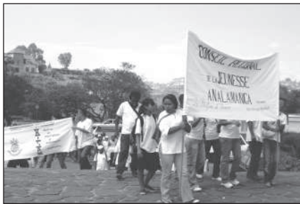
Ankatso : grande marche lors de la journée mondiale des volontaires pour le progrès, 2009.

Il y a cinq ans de cela, le Conseil des Jeunes a été mis en place pour la réalisation de la politique nationale de la jeunesse (loi n° 2004-028). A cette époque, les jeunes fraîchement élus membres du bureau croyaient beaucoup en la réussite de cette nouvelle stratégie. Quelques années plus tard, plusieurs d'entre eux ont désisté, la politique de mise en oeuvre paraissant floue à leurs yeux. Il en est de même pour les centaines d'associations existantes dans la région Analamanga : la structure a été mal connue et n'a pas été conçue comme étant un espace de dialogue et de concertation entre les jeunes.